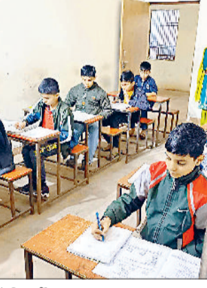
महेंद्रगढ़। परीक्षा देते विद्यार्थी।