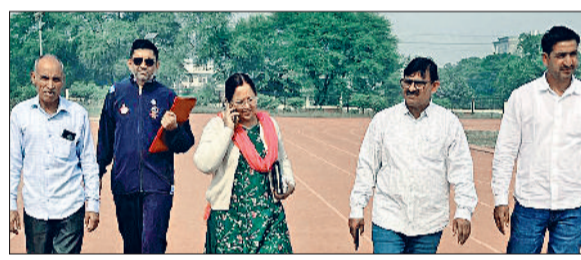
भिवानी। खेल प्रतियोगिता की तैयारियों का जायजा लेती डीईओ डॉ. निर्मल दहिया।

मिनी क्यूबा के नाम से विख्यात भिवानी एक बार फिर राष्ट्रीय स्तरीय स्कूली खेल प्रतियोगिता की मेजबानी के लिए तैयार है। भीम स्टेडियम में आगामी 26 से 30 नवंबर तक 5 दिवसीय राष्ट्रीय एथलेटिक्स स्पर्धाओं का आयोजन किया जाएगा। उन्होंने बताया कि महत्वपूर्ण प्रतियोगिता में अंडर-14, अंडर-17 व अंडर-19 आयु वर्ग के लड़के व लड़कियां विभिन्न एथलेटिक्स स्पर्धाओं में भाग लेंगे। प्रतियोगिता के सफल और सुव्यवस्थित आयोजन को सुनिश्चित करने के लिए, सोमवार को जिला शिक्षा अधिकारी डॉ. निर्मल दहिया