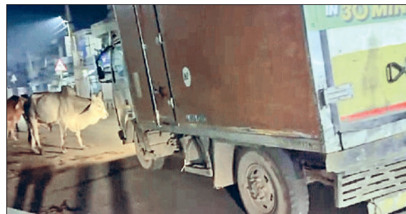
बवानीखेड़ा। बाबा कमाल मंदिर के पास रोड पर बैठे बेसहारा पशु व बच बचाकर गुजरते वाहन।