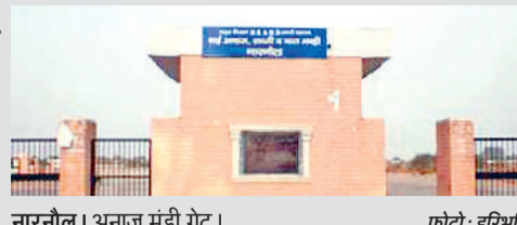
नारनौल। अनाज मंडी गेट।

सभी अनाज मंडियों और खरीद केंद्रों पर यह डिजिटल प्रणाली लागू कर दी गई है। उन्होंने कहा कि किसानों को अब गेट पास बनवाने के लिए इंतजार नहीं करना पड़ता। इससे मंडियों में अनुशासन और पारदर्शिता दोनों बढ़ेंगे। किसान अब अपनी फसल आसानी से और बिना परेशानों के बेच पा रहे हैं। डिजिटल गेट पास प्रणाली से किसानों को न केवल सुविधा मिली है, बल्कि उन्हें तकनीकी रूप से शक्ति भी बनाया गया है। राज्य सरकार की यह पहल अनाज मंडियों को डिजिटल युग की दिशा में आगे बढ़ाने वाला कदम साबित हो रही है।