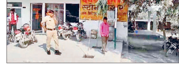
निजामपुर। घटना स्थल का निरीक्षण करती पुलिस।

बिगोपुर जेन में क्रैशर की होदी में पिसकर एक प्रवासी मजदूर की दर्दनाक मौत हो गई। तीन घंटे बाद सूचना लगने पर ऑपरेटर ने क्रैशर को बंद किया तथा अन्य श्रमिकों की मदद से क्षत विक्षत शव को बाहर निकाला। मृतक के परिजनों ने सुबह सुबह आक्रोश व्यक्त किया, लेकिन तीन घंटे बाद उनका गुस्सा ठंडा हो गया। उन्होंने पुलिस को इतफाकिया कार्रवाई के बयान दर्ज कराए हैं, जिसके आधार पर केस दर्ज करके शव का पोस्टमार्टम कराया गया है।