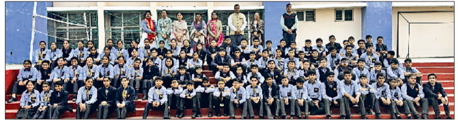
चरखीदादरी। लेवल 2 की परीक्षा के लिए चयनित विद्यार्थी।

हरिभूमि न्यूज ►► चरखी दादरी आरईडी विद्यालय के छात्रों का विज्ञान तथा तकनीकी मंत्रालय द्वारा आयोजित विद्यार्थी विज्ञान मंथन परीक्षा में भी अपना परचम लहराया। परीक्षा के लिए विद्यालय के 129 बच्चों ने परीक्षा दी, जिनमें से 112 बच्चों का लेवल 2 के लिए चयन हुआ है। लेवल 2 में चयनित छात्रों में छठी से 15, कक्षा सातवीं से 18, आठवीं से 31, नौवीं से 31