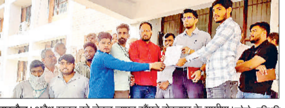
नारनौल। अवैध खनन को लेकर ज्ञापन सौंपते दोस्तपुर के ग्रामीण।

भी किया, लेकिन ढलान ज्यादा होने के कारण सफलता नहीं मिली तथा लुढ़कता हुआ पहले कन्वेयर में उलझा। इसके बाद चक्की में फंस्न गया। पत्थर व चक्की के बीच फंस्ने से श्रमिक की मौत होने का अंदेशा जताया गया है। घटना स्थल से अन्य श्रमिक थोड़ी दूरी पर काम कर रहे थे, जिन्हें घंटे भर तक घटना की भनक नहीं लगी। होद पर