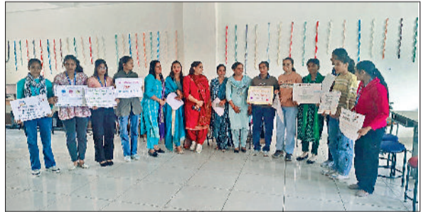
भिवानी। नारा लेखन प्रतियोगिता में भाग लेती छात्राएं।