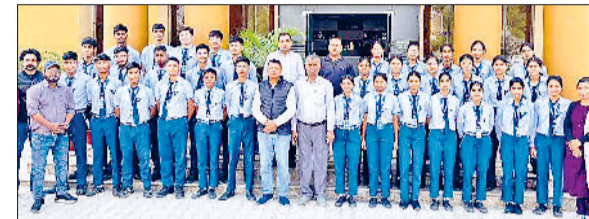
महेंद्रगढ़। विद्यार्थियों को सम्मानित करते हुए।

टैगोर सीनियर सेकेंडरी स्कूल के विद्यार्थियों ने एकबार फिर अपनी प्रतिभा और परिश्रम से विद्यालय का नाम रोशन किया है। विद्यालय के 47 विद्यार्थियों ने विज्ञान विद्यार्थी मंच की लेवल-1 परीक्षा उत्कृष्ट अंक के साथ उत्तीर्ण कर लेवल-2 परीक्षा के लिए चयन प्राप्त किया है। यह परीक्षा भारत सरकार के विज्ञान एवं प्रौद्योगिकी मंत्रालय और विज्ञान प्रसार के संयुक्त तत्वावधान में राष्ट्रीय स्तर पर आयोजित की जाती है। इसका उद्देश्य विद्यार्थियों में विज्ञान के प्रति जिज्ञासा, नवाचार की भावना और अनुसंधान