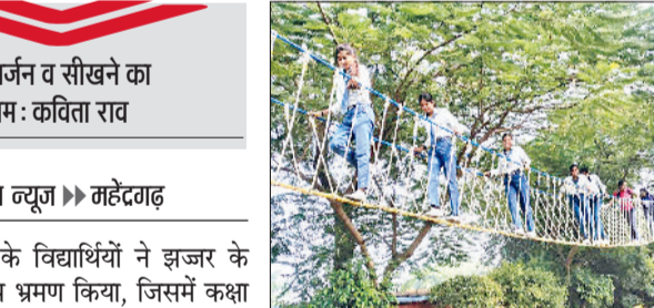
महेंद्रगढ़। भ्रमण में रोप कोर्स का आनंद उठाते श्रीकृष्णा स्कूल के विद्यार्थी।