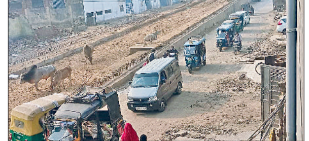
भिवानी। निर्माणधीन लोहारू रोड रेलवे ओवरब्रिज व सर्विस रोड का निर्माण न होने से उबड़ खाबड़ रास्ते से गुजरने वाहन चालक।