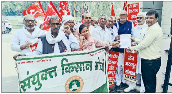
भिवानी। लंबित मांगों को लेकर ज्ञापन सौंपते संयुक्त किसान मोर्चा के सदस्य।

लाख रुपये प्रति एकड़ मुआवजा, खेतों में भरे जलभराव की पूरी निकासी, बाजरा, कपास व धान की सरकारी खरीद नहीं करने से हुए नुकसान का भौतावर देने, धान की फसल में नमी 17 प्रतिशत से 22 प्रतिशत छूट, बारिश से नष्ट हुए मकानों का मुआवजा, 2023 के बर्बाद कपास फसल का 350 करोड़ रुपये बीमा फ्रॉड का समाधान, बकाया ट्यूबवैल