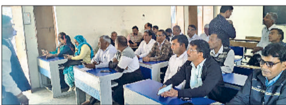
बाढ़ड़ा। प्राथमिक शिक्षकों को संबोधित करते ट्रेनर।

राजकीय वरिष्ठ माध्यमिक विद्यालय काकड़ौली सरदाया में निपुण हरियाणा मिशन के अंतर्गत विशेष आवश्यकता वाले बच्चों की पहचान के लिए बाल दालस उत्सव एवं राज्यव्यापी स्क्रीनिंग कार्यक्रम संबंधी प्राथमिक अध्यापकों का प्रशिक्षण आयोजित किया। प्रशिक्षण में क्वार्टर काकड़ौली सरदाया, द्वारका डोहका मौजी व हाड़ौदी के अंतर्गत आने वाले प्राथमिक के विद्यालयों के अध्यापकों ने भाग लिया। प्रशिक्षण के मास्टर ट्रेनर खंड