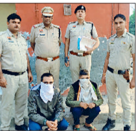
पुलिस हिरासत में आरोपी।